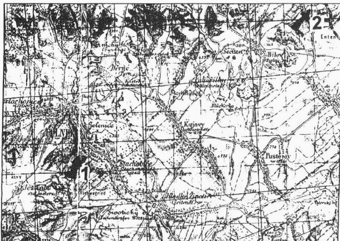
Obr.1. Lokalizace paleolitických stanic Stachovice a Bílovec - Localisation of the Paleolithic sites Stachovice and Bílovec

V dubnu roku 1997 autor příspěvku při terénním průzkumu v okolí Bílovce získal povrchovým sběrem malou kolekci mladopaleolitických artefaktů. Lokalita se nachází jižně od města asi 1 km (na plánu je vyznačena tečkovaně), na vrcholu kopce (nadmořská výška 312 m), mezi pravou stranou silnice Příbor - Studénka (Butovice) - Bílovec, polní cestou a sloupem elektrického vedení s vysokým napětím. Plocha archeologické lokality je necelý 1 ha. Poloha paleolitické stanice poskytovala dokonalý rozhled do okolní krajiny.