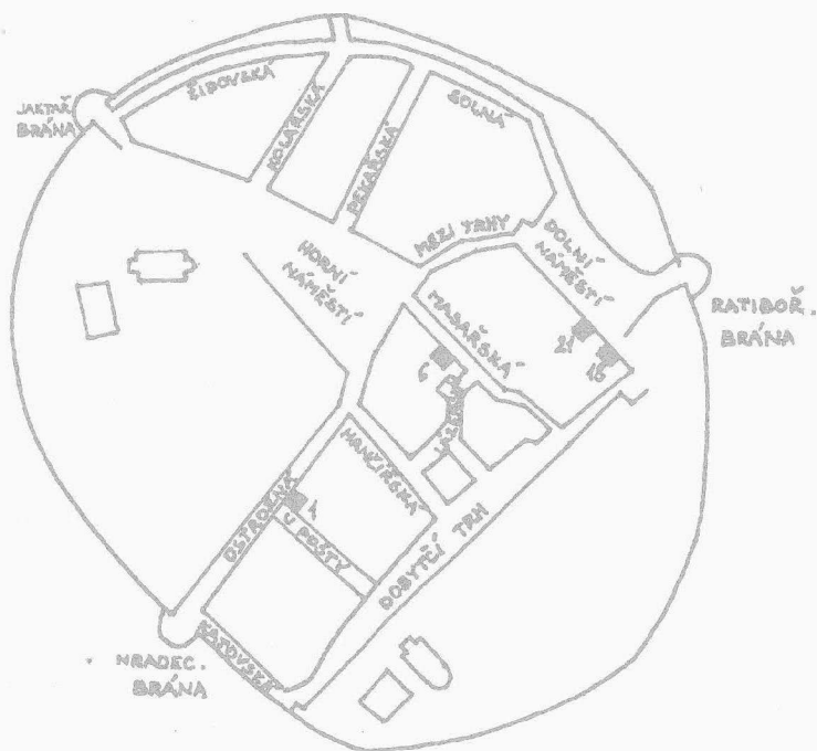
Obr. 1. Schematický plán středověké vnitřní Opavy (podla J. Bakaly) s vyznačením objektů, v nichž se uskutečnil záchranný výzkum v r. 1994 a 1995

Neplánovaná záchranná akce v lednu 1994 proběhla v zadní části domu, kde se arch. oddělení angažovalo už na podzim roku 1992 v místech dnešních sklepů, odkud byl tehdy získán pouze novověký materiál. Výkopové práce na větrací šachtě, tentokrát v zadní nepodsklepené partii domu, byly prováděny pokoutně, bez řádného ohlášení. V době příchodu pracovníků PÚ byla již značná část šachty vykopána a materiál vyvezen. Zbývající výkop měl rozměry cca 3,50 x 2,20 m a byl situován ve směru S-J při východní obvodové zdi budovy.