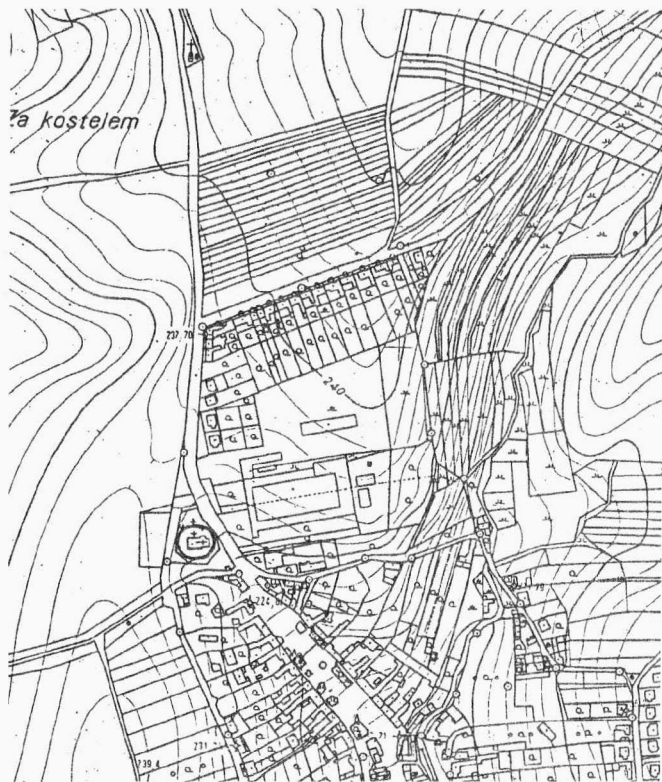
Obr.1. Tečovice. Poloha kostela sv. Jakuba Většího, výřez z kat. mapy 1:5000

hlavního vchodu lodi ze západní strany má profilované ostění, na jehož základové patce se dochovala kamenická značka stavební huti.