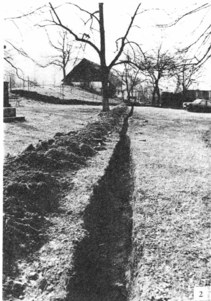
Tab. 27. Černvír (okr. Žďár nad Sázavou). Náhorní plošina výšiny "Hradisko" s kostelem P. Marie, duben 1992. 1, 2 - trasa rýhy pro elektrokabel, vedené od jižního průčelí kostela na zahradu č. p. 16 a obsahující keramiku 2. poloviny 13. století.