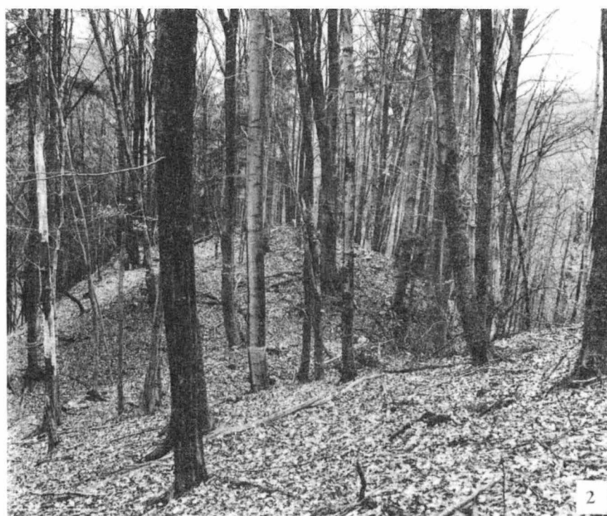
Tab. 25. Babice nad Svitavou (okr. Brno-venkov), středověká fortifikace nad údolím Křtinského potoka, duben 1993. 1, 2 - čelo opevnění s přístupovou komunikací vlevo a zdvojeným šijovým příkopem od JV.

Doležel, Vrcholně středověká fortifikace...str. 76-77