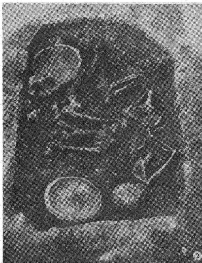
Tab.10. Záhlinice (okr. Kroměříž). 1 hr. 1, 2 hr. 67. - Grab 1, 2 Grab 67.