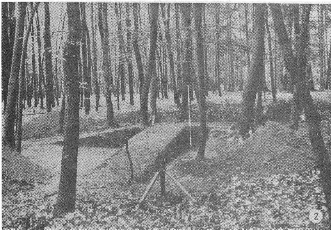
Tab.6. Slavičín (okr. Zlín). 1 poloha "Kulatý trávník", pohled na mohyly před výzkumem; 2 trať "Nivka", průzkum mohyly. - 1 Lage "Kulatý trávník", Ansicht auf den Hügel- grab vor den Grabungsanfängen", 2 Lage "Nivka", Untersuchung des Hügelgrabes.