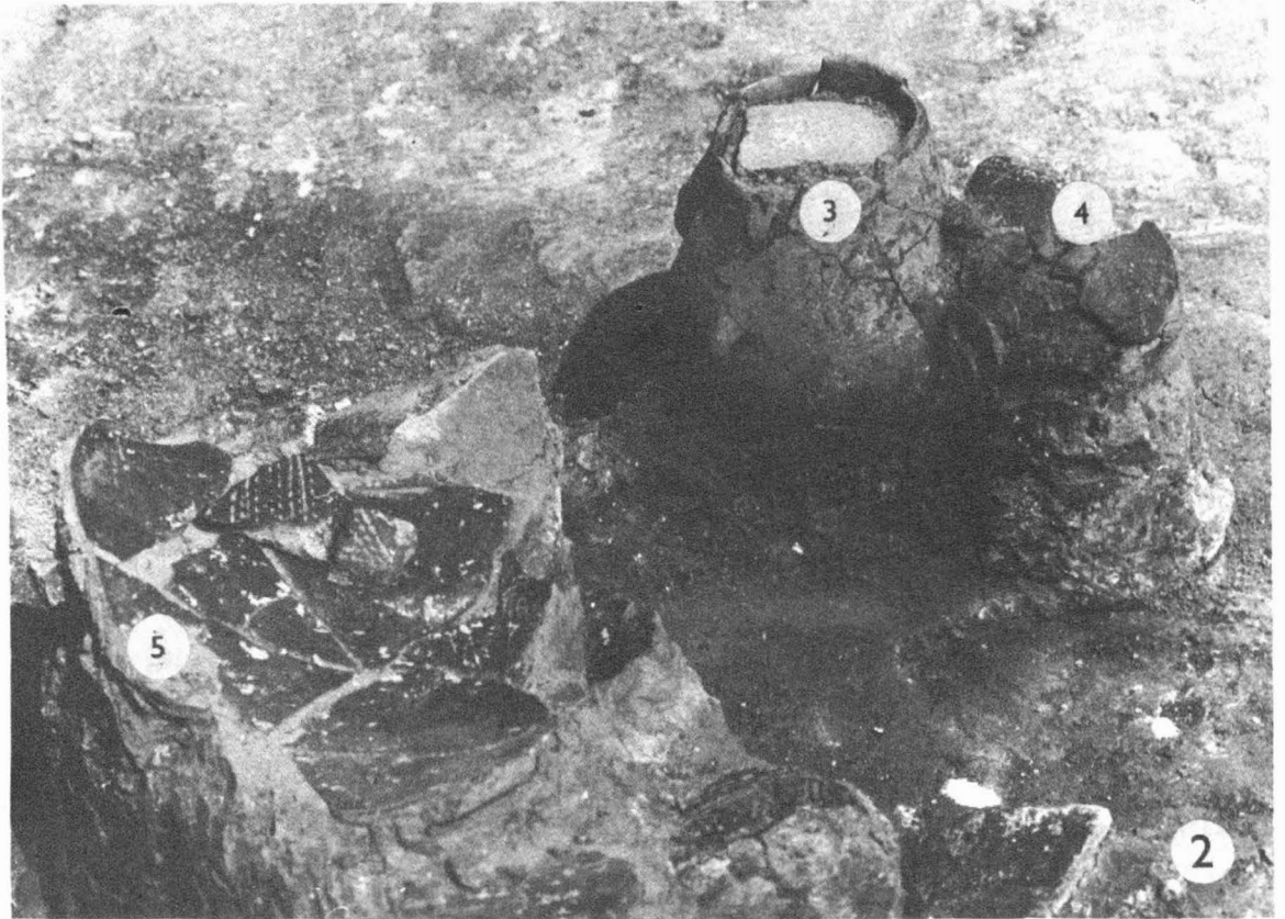
Tab. 4. Těšetice - Kyjovice /okr. Znojmo/. 1 seskupení nádob v hrobu H 12 s vypíchanou keramikou; 2 situace po vyzvednutí misky /2/ a kotlovité nádoby /1/, poloha nádoby obsahující barvivo /3/. - 1 Gefässgruppierung in Grab H 12 mit Stichbandkeramik; 2 Situation nach der Bergung der Schüssel /2/ und des kesselförmigen Gefäßes /1/, Lage des Gefäßes mit Farbstoffinhalt /3/.