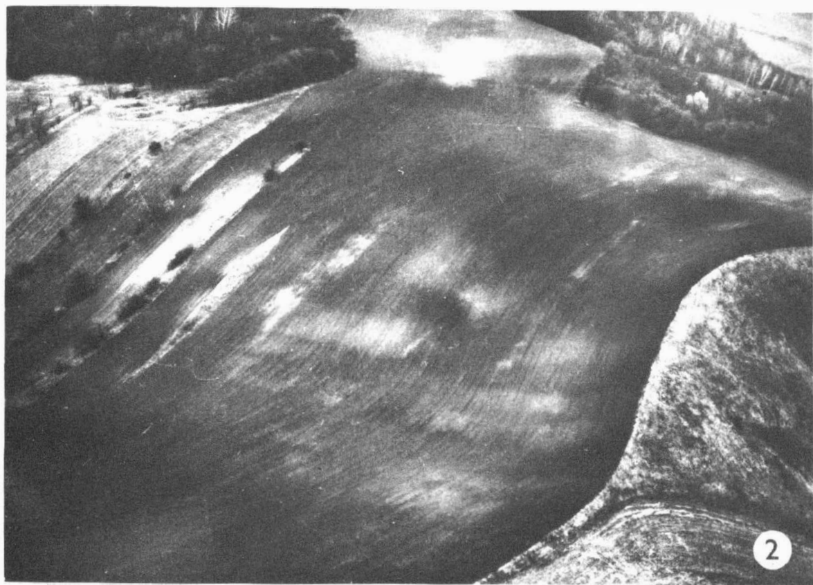
Tab. 13. Letecké snímkování. 1, 2 Marefy /okr. Vyškov/ "Člupy". - Luftbildaufnahmen. 1, 2 Marefy /Bez. Vyškov/.