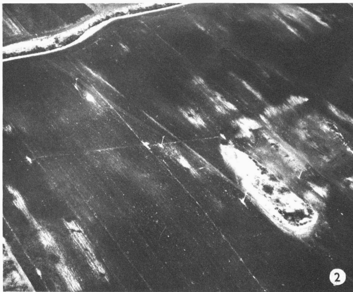
Tab. 14. Letecké snímkování. 1 Vážany nad Litavou /okr. Vyškov/; 2 Křenovice - Hrušky /okr. Vyškov/. - Luftbildaufnahmen. 1 Vážany nad Litavou /Bez. Vyškov/; 2 Křenovice - Hrušky /Bez. Vyškov/.