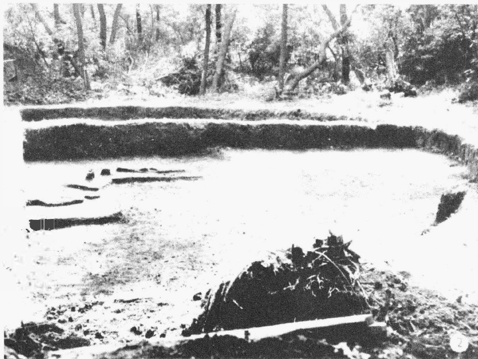
Tab. 3. Borotice /okr. Znojmo/. 1 mohyla 4 před-výzkumem; 2 jižní polovina mohyly 4 po výzkumu. - Hügelgrab 4 vor der Grabung; 2 Südhälfte des Hügelgrabes 4 nach der Grabung.