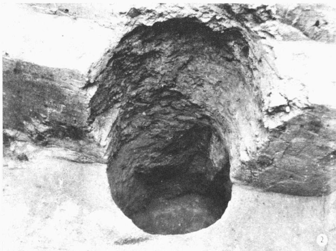
Tab. 2. Budkovice /okr. Brno-venkov/. 1 profil středověkého objektu II v sondě V; 2 kúlová jáma č. 14 u východní stěny věteřovského objektu I. - 1 Profil des mittelalterlichen Objektes II in Sonde V; 2 Pfostengrube Nr. 14 bei der Ostwand des Věteřover-Objektes I.