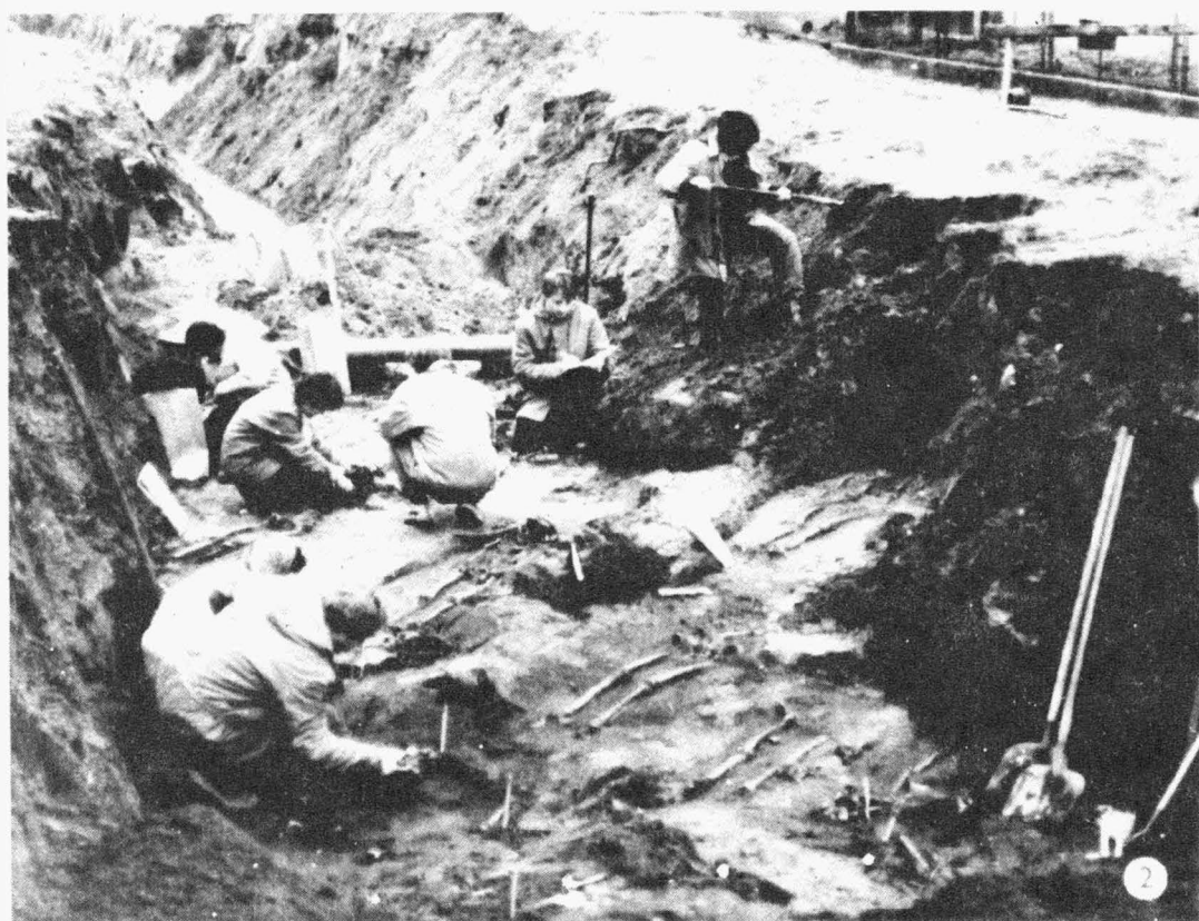
Tab. 8. Mikulčice-obec /okr. Hodonín/. Zachraňovací výzkum na pohřebišti porušeném výkopem kanalizační rýhy. Pracovní záběry. - Rettungsgrabung auf dem, durch den Aushub eines Kanalisationsgrabens gestörten Gräberfeld. Arbeitsaufnahmen.