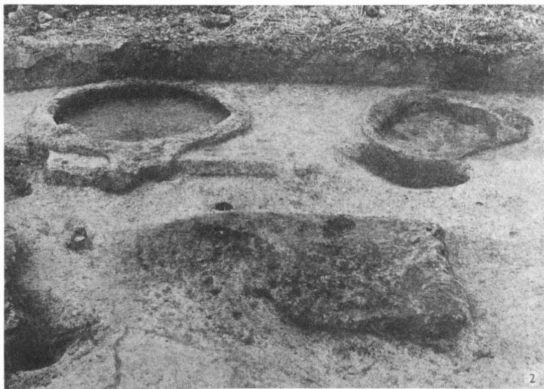
Tab. 9 Lehotice /okr. Kroměříž/. Slovanské sídliště. 1 objekt B4/82, pec s předpecní jámou; 2 objekt B1/82. - Slawische Siedlung. 1 Objekt B4/82, Ofen mit Vorofengrube; 2 Objekt B1/82.