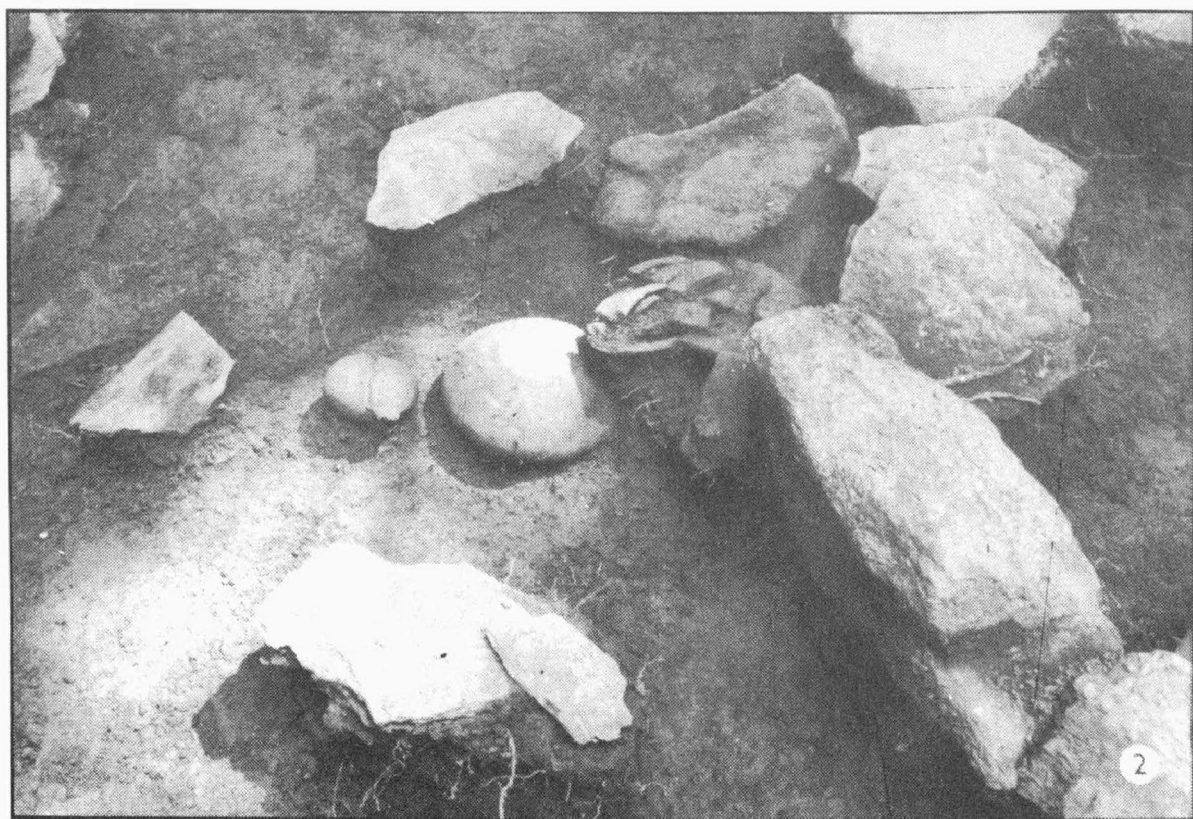
Tab. 7 Slatinky /okr. Prostějov/, "Kosíř". Mohyla IV. 1 kamenná konstrukce mohyly od východu; 2 hrob č. 2. Grabhügel IV. 1 Steinkonstruktion des Grabhügels von Osten; 2 Grab Nr. 2.