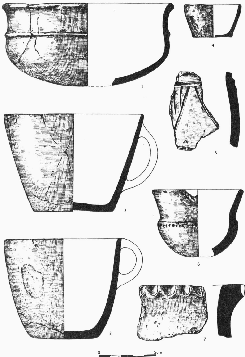
Obr. 6 Moravský Žižkov /okr. Břeclav/. Výběr nálezů ze sídliště mohylové a velatické kultury a z doby laténské /1/. - Auswahl von Funden aus der Hügelgräber- und Velaticersiedlung und aus der Latenezeit.