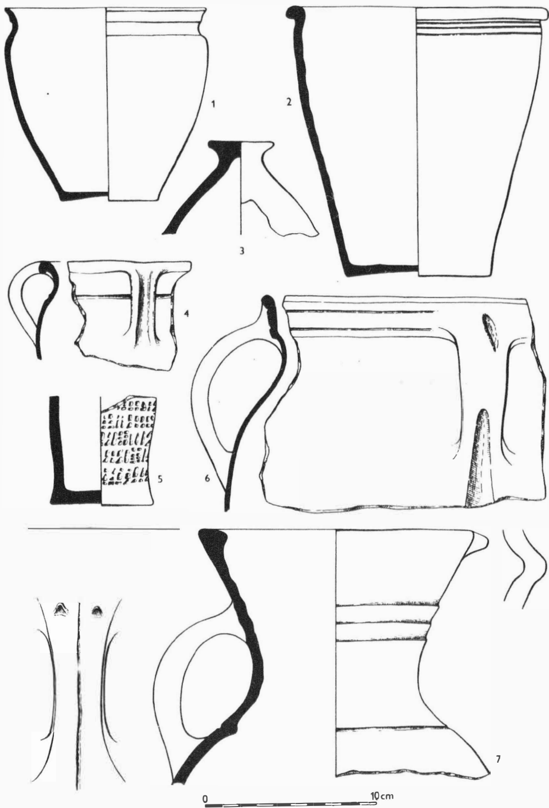
Obr. 17 Milovice /okr. Břeclav/. Výběr středověkého materiálu. - Auswahl an mittelalterlichem Material.