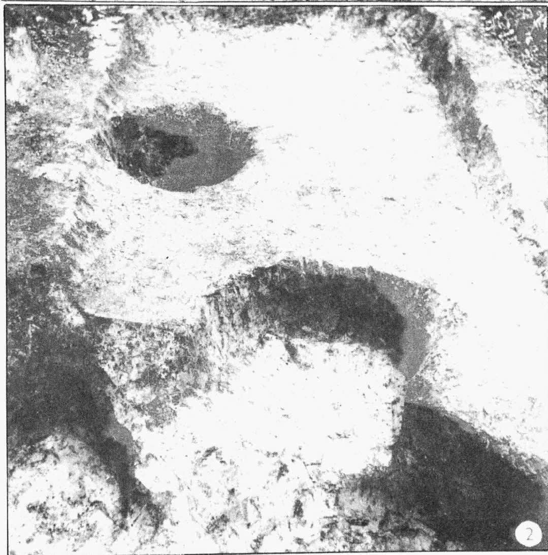
Tab. 3 Palonín /okr. Šumperk/, Zachraňovací výzkum v roce 1979. 1 část plochy sídliště lužické kultury s kúlovými jamkami; 2 slovanský objekt. - Rettungsgrabung im Jahre 1979. 1 Teil der Siedlungsfläche der Lausitzer Kultur mit Pfostengruben; 2 slawisches Objekt.