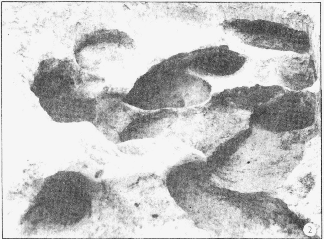
Tab. 4 Palonín /okr. Šumperk/. Zachraňovací výzkum v roce 1979. 1 slovanský zemnicový objekt; 2 středověký hliník. - Rettungsgrabung im Jahre 1979. 1 slawisches Erdbauobjekt; 2 mittelalterliche Lehmgrube.