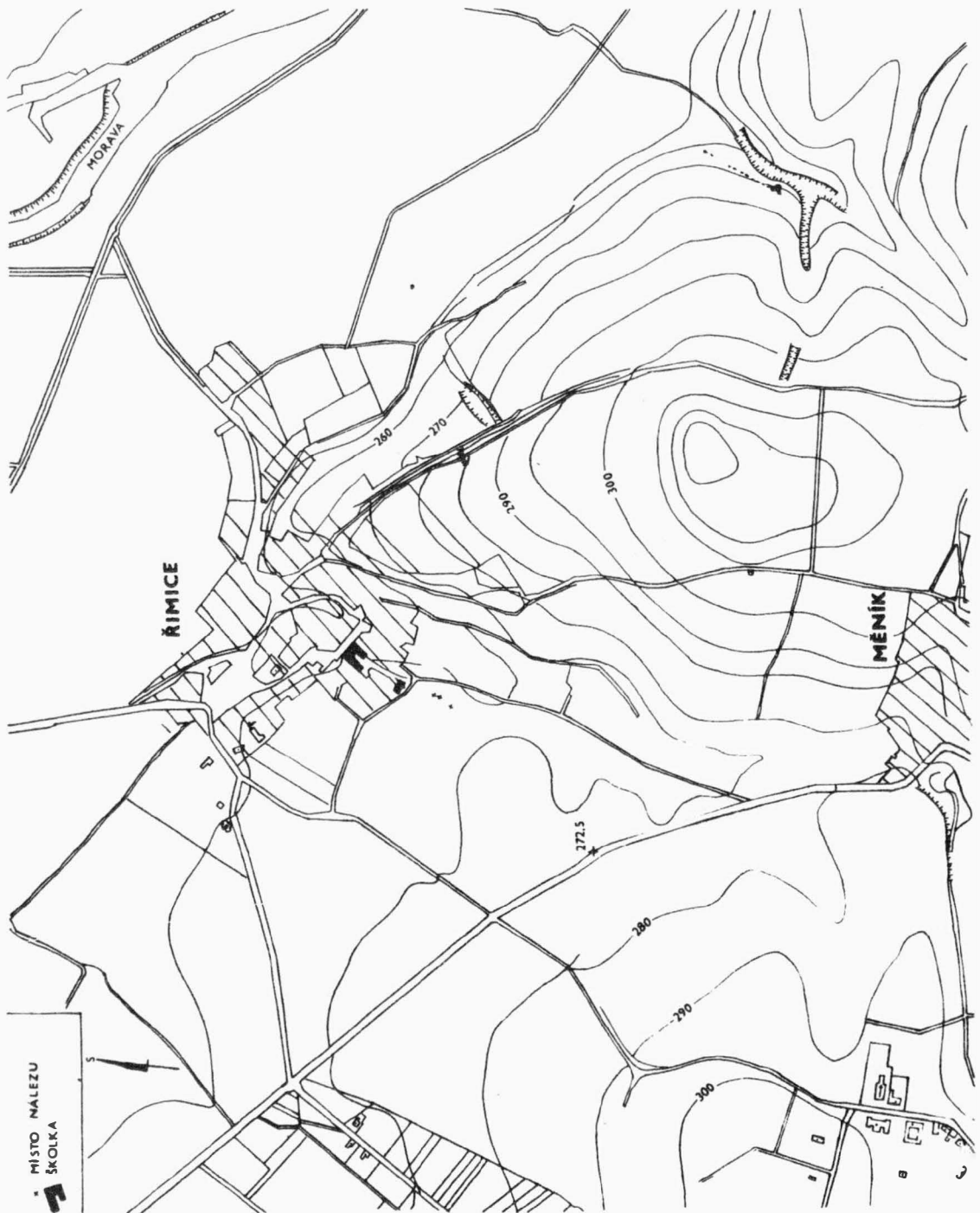
Obr. 2 Řimice /okr. Olomouc/. Situační plán lokality v terénu. - Situationsplan der Lage der Lokalität im Terrain.