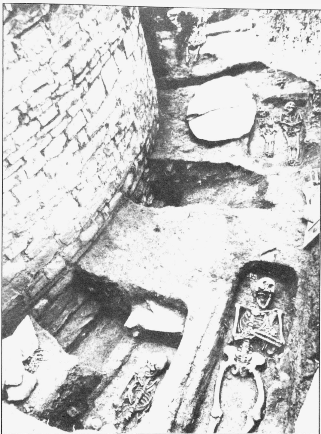
Tab. 9 Pustiměř /okr. Vyškov/. Výzkum pohřebiště z mladší a pozdní doby hradištní severně od rotundy. Pohled od východu. - Grabung des Gräberfeldes aus der jüngeren und späten Burgwallzeit nördlich der Rotunde. Ansicht von Osten.