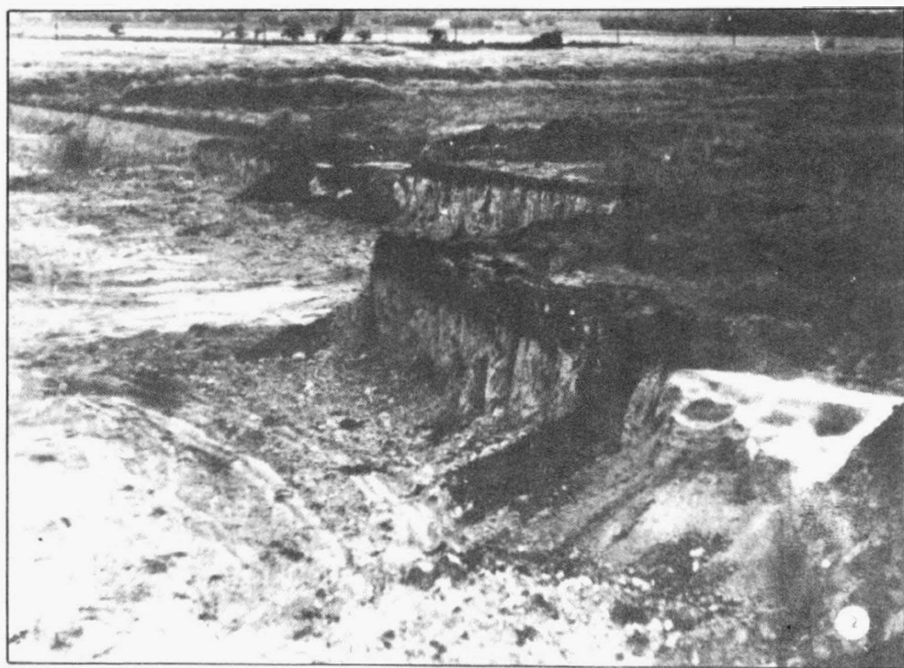
Tab. 2 Pavlov /okr. Břeclav/. Sídliště lidu s moravskou malovanou keramikou. 1 situační schéma lokality; 2 pohled na část lokality od jihovýchodu /objekty č. 7 a 8/. - Siedlung der Träger der mährischen bemalten Keramik. 1 Situationsschema der Lokalität; 2 Ansicht auf einen Teil der Lokalität von Südost /Objekte Nr. 7 und 8/.