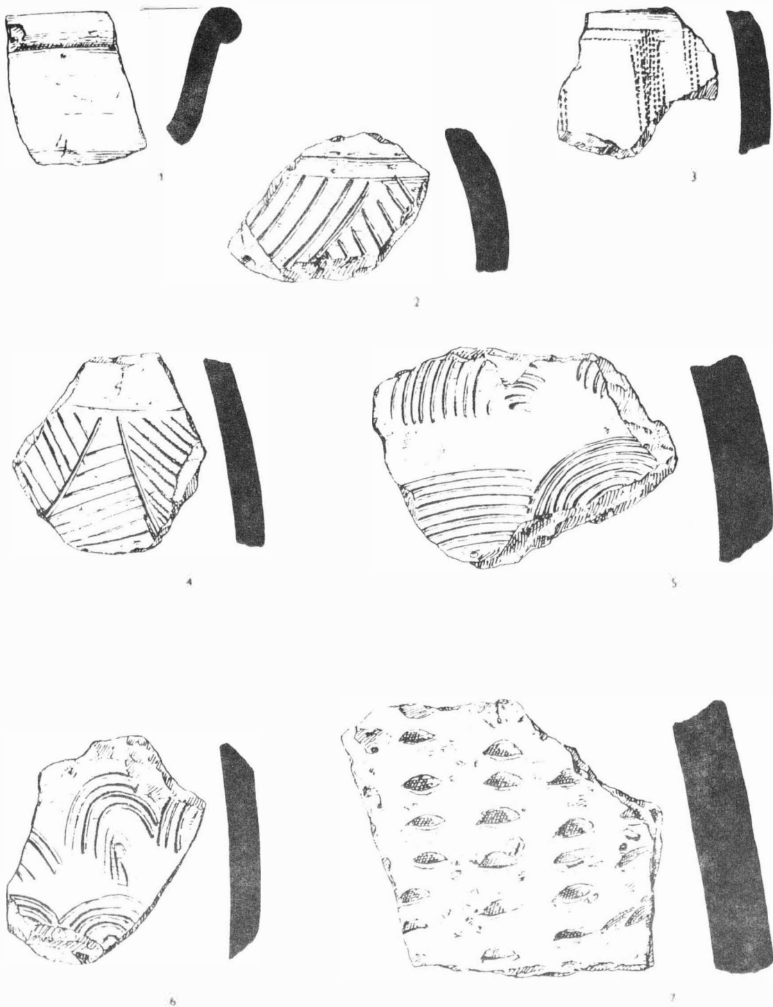
Obr. 41 Milovice /okr. Břeclav/. Nález z povrchového sběru. - Lesefunde.