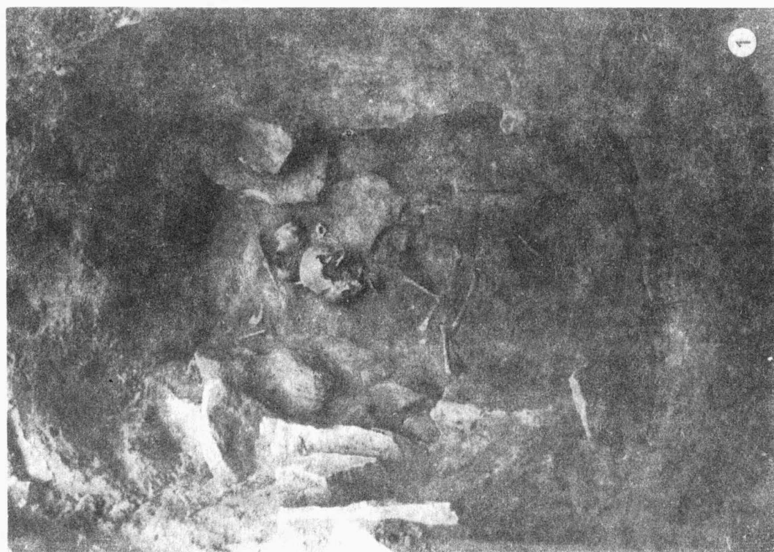
Tab. 2 Slatinky /okr. Prostějov /. 1 mohyla 1, hrob 1; 2 mohyla 1, hrob 2. - 1 Hügelgrab 1, Grab 1; 2 Hügelgrab 1, Grab 1; 2 Hügelgrab 1, Grab 2.