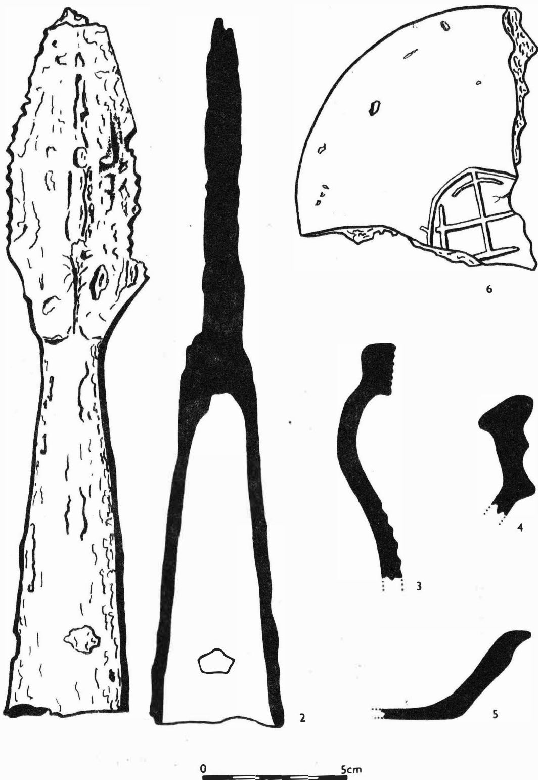
Obr. 55 Bruntál /okr. Bruntál / . Zámek. Nálezy ze sondy 1c. - Schloss. Funde aus dem Schnitt 1c.