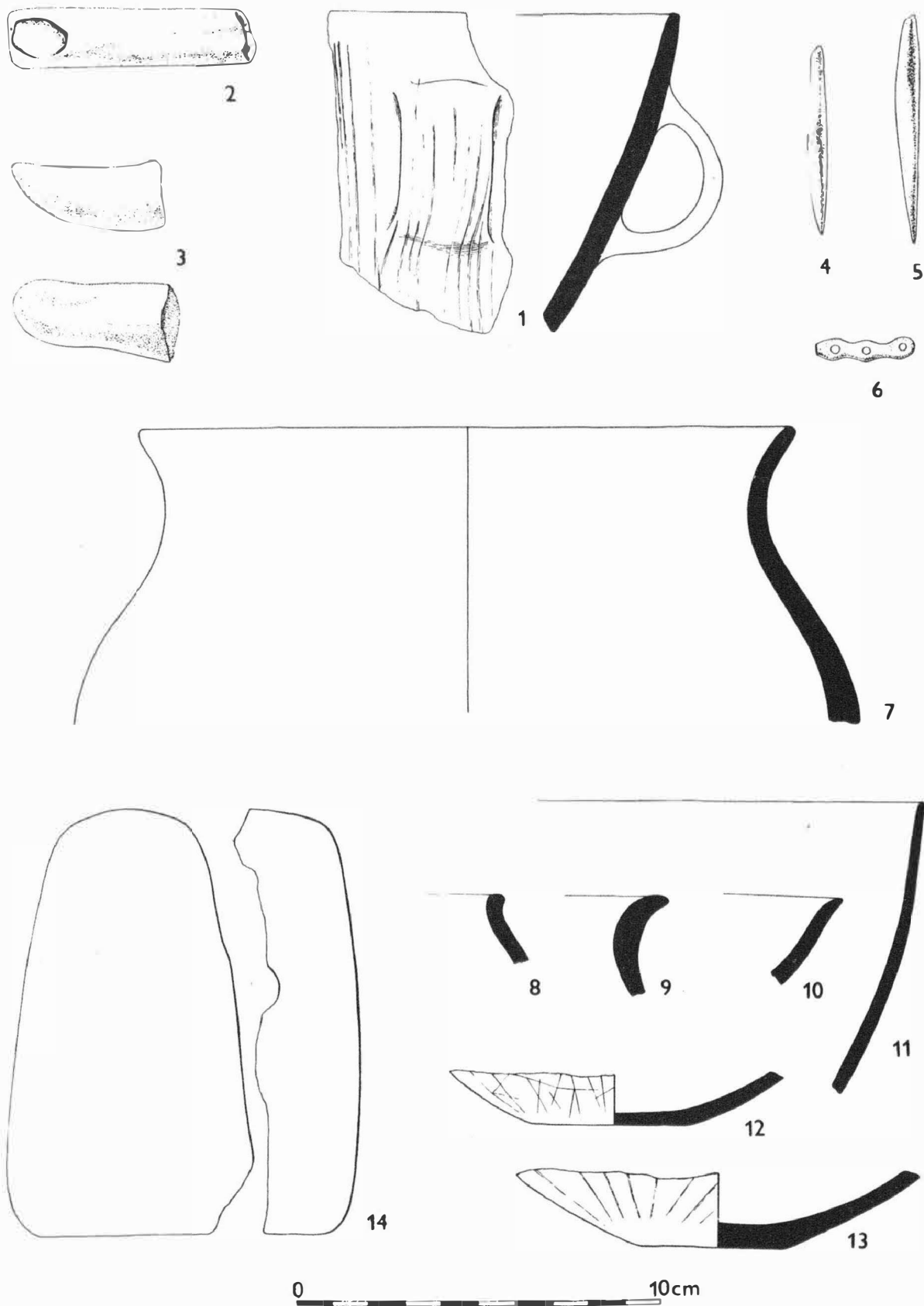
Obr. 5 Bulhary /okr. Břeclav/. Velatická kultura. 1-2 výběr materiálu z vrstvy nad jámami ; 3 jáma č. 1 ; 4-14 jáma č. 2. - Velaticer Kultur. 1-2 Materialauswahl aus der Schicht oberhalb der Gruben ; 3 Grube Nr. 1 ; 4 - 14 Grube Nr. 2.