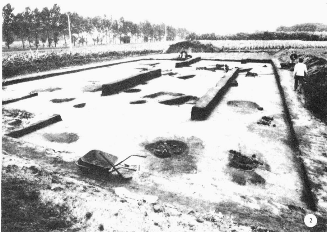
Tab. 19 Mutěnice /okr. Hodonín/. 1 celkový pohled na lokalitu ; 2 celkový pohled na odkrytou plochu. - 1 Gesamt- ansicht auf die Lokalität ; 2 Gesamtansicht auf die abgedeckte Fläche.