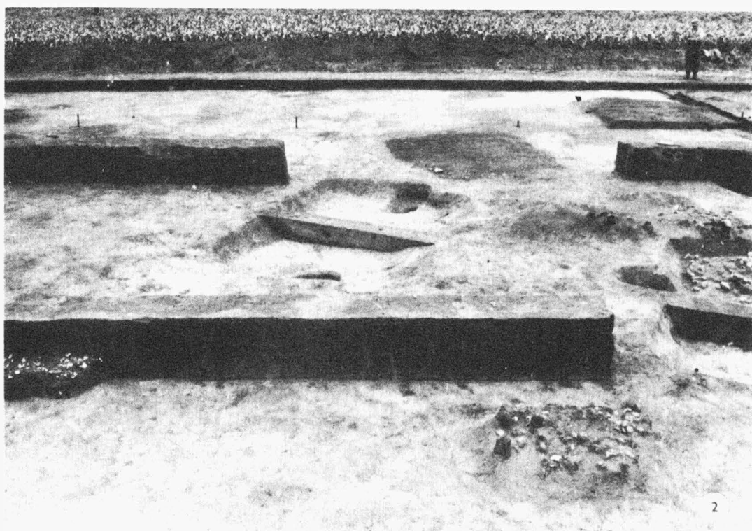
Tab. 20 Mutěnice /okr. Hodonín/. 1 objekt č. 7 ; 2 objekt č. 5. - Objekt Nr. 7 ; Objekt Nr. 5.