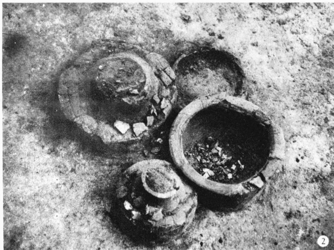
Tab. 18 Podolí / okr. Brno-venkov/ . 1 žárový hrob č. 1/74 ; 2 žárový hrob 2/74. - 1 Brandgrab Nr. 1/74 ; 2 Brandgrab Nr. 2/74.