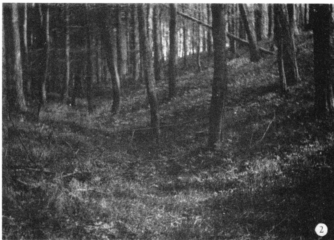
Tab. 17 Bohuslavice / okr. Hodonín / "Hradisko". 1 levé křídlo brány ; 2 pohled na val a příkop. - 1 der linke Torflügel ; 2 Wall- und Grabenansicht.