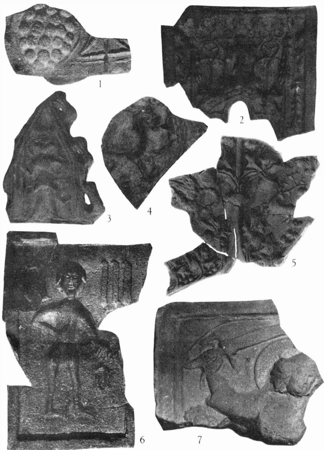
Tab. 62 Koryčany / okr. Kroměříž / . Hrad Cimburk. Zlomky kachlů. - Burg Cimburk. Bruchstücke von Ofenkacheln.