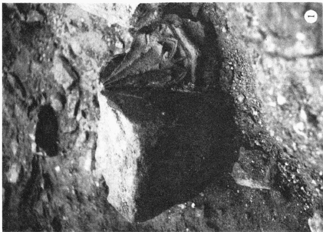
10, 51 Dolany / okr. Olomouc /. Kartuziánský klášter, místnost R. 1 kružbová konzola v destrukci ; 2 destrukce výběhů klenebních žebér. - Karthäuser Kloster, Raum R. 1 Maßwerkkonsole in der Destruktion ; 2 De- struktion von Ausläufern der Gewölberippen.