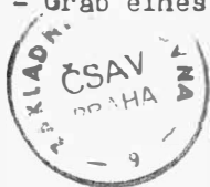
Tab. 42 1 - Mikulčice (o.Hodonín). Tausovaná značka na meči z hrobky velmože od trojlodního kostela. - Tauschiertes Zeichen auf einem Schwert aus einer Fürstengruft bei der dreischiffigen Kirche; 2 - Blučina (o.Brno-venkov). Hrob slovanského bojovníka. - Grab eines slawischen Kriegers.