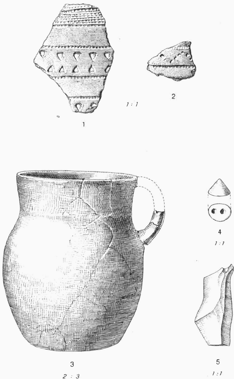
Tab. 7. 1,2 Hradčany-Kobeřice / okr. Prostějov/. Kultura zvoncovitých pohárů, povrchový sběr. - Glockenbecherkultur, Lesefunde; 3-5 Lovčičky / okr. Vyškov /. Kostrový hrob kultury zvoncovitých pohárů. - Skelettgrab der Glockenbecherkultur.