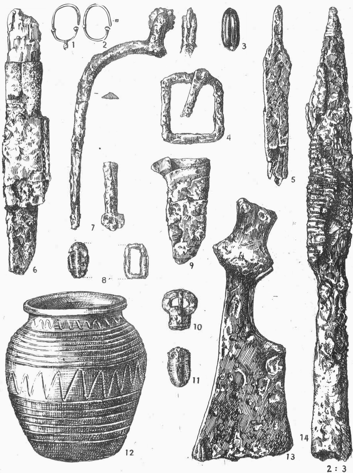
Tab. 36. Hostěrádky-Rešov, okr. Vyškov. Výběr materiálu ze slovanských kostrových hrobů.- Auswahl an Material aus slawischen Skelettgräbern.