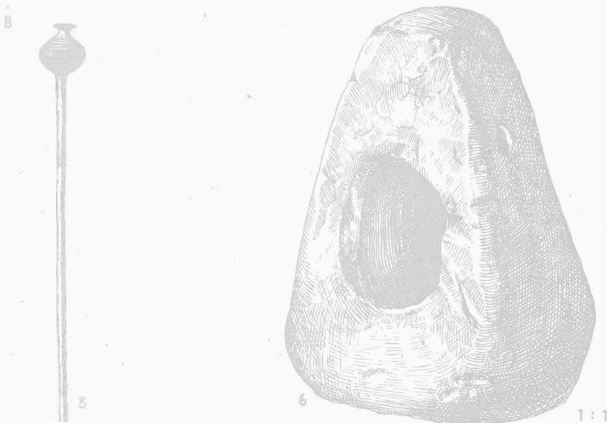
Tab. 21. A. Oblekovice u Znojma. Bronzové předměty a hliněná nádobka ve tvaru boty; B. Klentnice u Mikulova. Bronzová jehlice a hliněný jehlan z velaticko-podolského sídliště. - A. Bronzene Gegenstände und ein tönernes Gefäßchen in Schuhform. B. Bronzenadel und tönerne Pyramide aus der Velaticer-Podoler Siedlung.